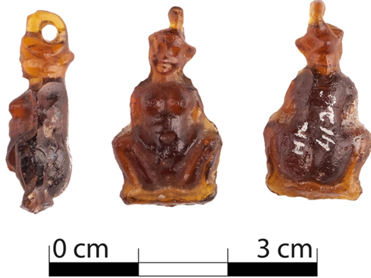
Figür 2: Sadberk Hanım Müzesi cam amulet.

Amulet-2: Sadberk Hanım Müzesi Koleksiyonu'nda yer alan eserin buluntu yeri bilinmemektedir 2 . Kehribar renkli yarı opak cam hamurundan yapılan amulet 22 mm yüksekliğinde, 12 mm genişliğindedir (fig. 2). Sağlam olarak günümüze ulaşan figürün yüzünde iri gözle tezat oluşturacak biçimde küçük burun ve dudak profili izlenir. Amulet-1'de olduğu gibi omuzlar dar, göğüsler iri, karın şiş, göbek deliği geniş verilmiş olup, elleriyle kasık bölgesine bastırmaktadır. Profilden verilen bacaklar genital bölgeyi açıkta bırakacak şekilde yanlara doğru açılır. Sadberk Hanım Müzesi örneğinin gerek ölçü gerekse yüz ve vücut detaylarının Gaye Çarmıklı Koleksiyonu amuleti ile benzerliği kalıp birlikteliğini düşündürür.