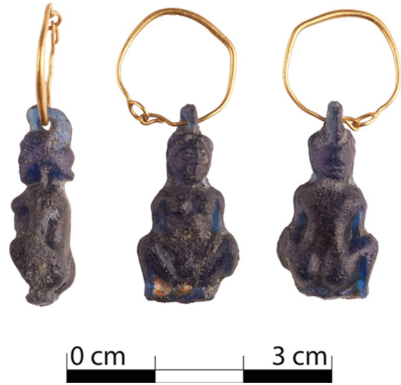
Figür 3: Sadberk Hanım Müzesi cam amulet.

Detaydan uzak ancak bir o kadar da plastik betimlenen kadın figürlerinin yapımında farklı renkte cam hamurlarının tercih edilmesine ek olarak saç, yüz, göğüs ve göbek deliğinin verilmişindeki farklılıklar, kalıp çeşitliliğine de işaret etmektedir. Özellikle türban ya da kekryphalos benzeri bir saç aksesuarıyla çeşitlenen saç modelleri, ana şablonu zenginleştiren küçük dokunuşlardır 11 . Bu amuletler için başlangıçta Fenike ya da Levant