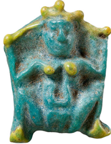
Figür 9: Baubo-Omphale amulet, Roma Dönemi, Metropolitan Müzesi (Nifosi 2022, 183, fig. 6).

Doğum esnasında çömelen, çıplak kadın figürlerinin doğurganlığı ve yeniden dirilişi simgeleyen Omphale karakteri dışında Trak tanrıçası Kottyto/Kotys ile de özdeşleştirilmesi, farklı coğrafyalarda benzer algı olduğunu göstermesi açısından önemlidir 61 .