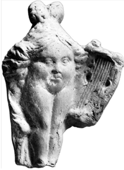
Figür 6: Priene buluntusu Baubo (Raeder 1984, 85, abb. 23b)

Demeter'in insanlığa tarımı öğretmesi için yetiştirdiği Triptolemos'un annesi olmasıdır 33 . Özde Eleusis gizem dininin önemli karakterlerinden biri olarak kabul edebileceğimiz Baubo, tarım ve bereket ile ilişkili olup, en yaygın görsel anlatımı da mitolojide vurgulandığı biçimde eteğini kaldırarak cinsel bölgesini gösterdiği versiyonudur 34 (fig. 6). Karın boşluğuna eklenen baş ile karikatürize edilen bu figürinlerle, kökeni MÖ 2. bine kadar uzanan Yakın Doğu kültürlerine ait anasyrma gestusu Hellenistik Dönem Yunan görsel sanatına taşınır 35 . Mısır'da tanrıça Hathor'un babası Ra'yı neşelendirmek için aynı gestusu yaparak onu kahkahalara boğması, bölgede bu hareketin en depresif duygu durumuna sahip ilahi karakteri bile normalleştirecek güçte dini bir eylem olarak kabul görmesinde etkili olmuştur 36 .