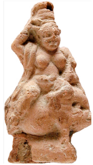
Figür 7: Mısır'dan boğa üzerinde Baubo, Greko-Roma Dönemi (Nifosi 2022, 182, fig. 5).

Hamile kadın anlatımları zamanla yerini çocuğunu emziren ya da taşıyan kadınlara bırakır. Doğum yapan kadın betimlemeleriyle aynı düşünceden köklendiği için bu tiplerin de kronolojik gelişimine değinmemiz gerekir. Literatürde kourotrophos olarak tanımlanan bu ikonografi, çömelen kadınlar gibi Anadolu Neolitik'te Çatalhöyük'te karşımıza çıkar 45 . MÖ 14. yüzyıla tarihlenen altın kolye sarkacında, Hitit tanrıçası kucığında çocuğuyla Çatalhöyük ana tanrıçasını andıran biçimde aslan pençeleriyle süslü kolçaklı bir tahta oturur şekilde betimlenir 46 . Mısır'da ise MÖ 15. yüzyıl kadınları tanrı ya da firavun olarak tanımlanan karakterleri taşıırken betimlenir 47 . Aslında çocuk taşıyan kadın figürleri için süregelen en önemli tartışma da tam olarak bu noktada yoğunlaşır. Demir Çağı'nda başlayan ve Roma Dönemi'ne kadar devam eden kourotrophos betimlemelerinin bir tanrıçayı mı yoksa ölümlü bir kadını mı temsil ettikleri belli değildir. Kesin olan husus, bu figürinleri sipariş eden kitlenin hamile ya da çocuklu kadınlar olduğu, bu zor süreçte ilahi bir güç aracılığıyla hem kendilerini hem de çocuklarını korumayı hedefledikleridir. Bu bağlamda Yunanistan 48 ve Anadolu'da 49 Demeter-Persephone gibi kadın ve bununla ilintili olarak doğum ile ilgili tanrıçaların kült merkezlerinde bulunan terracottalar içerisinde kourotrophos ikonografisi yoğunluk gösterir ve Anadolu'da yerli ana tanrıçalarla özdeşleştirilen Artemis, Aphrodite ve Demeter'in görsel anlatımlarında sıklıkla kullanılır 50 .