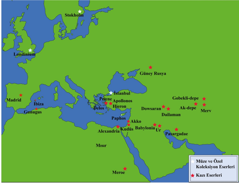
Figür 5: Bugüne kadar bulunmuş cam amuletlerin dağılımını gösterir harita (Çizim: Tuğba Teze).

kollarının olmayışı ve üst gövdesinin giysili oluşuyla farklıdır. Stilize anlatıma bağlı oluşan bu farklılıklara karşın amuletin Hellenistik Dönem sonu ile MS 1. yüzyıla tarihlenen Mısır'dan karnelyan bir örnekle benzerlik göstermesi, Tralleis kemik kadın figürünü için önerilen tarihin MS 1.-2. yüzyıla, yani Erken Roma İmparatorluk Dönemi'ne çekilmesi gerektiğini düşündürür 27 .