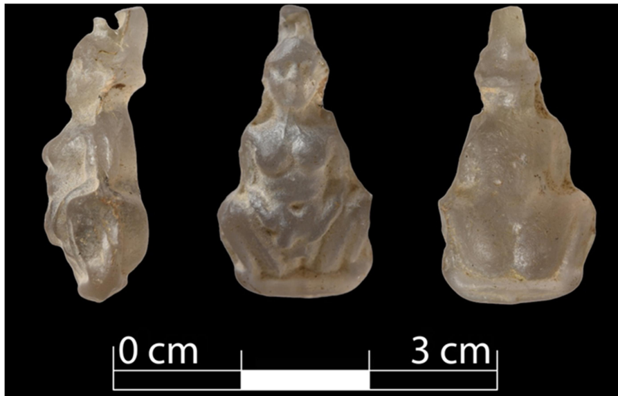
Figür 1: Gaye Çarmıklı Koleksiyonu cam amulet.

Kollar dirsekten bükülerek kasıklara baskı uygularcasına karnı kavrar. Çömelme hareketine bağlı olarak dizler her iki yana doğru açılmış, bitişik vaziyetteki bacaklar profilden, ayaklar ise hafif \frac{3}{4} cepheden betimlenmiştir. Kalça sağlam bir şekilde zemin çizgisine otururken, vulvanın doğum için açılmaya başladığı dikey ince bir çizgi şeklinde betimlenmesinden anlaşılır. El ve ayaklarda, vücudun genelinde olduğu gibi parmaklar detaylı olarak işlenmemiştir. Figürün göğüsleri hamileliği vurgularcasına iri ve dolgundur. Göğsün altında bükülme hareketinden kaynaklı göbük üzerine yığılan yağ katmanları yatay çizgilerle gösterilmiştir. Benzer şekilde geniş göbük deliği de derin işlenerek figürün genelindeki plastik stil devam ettirilmiştir.