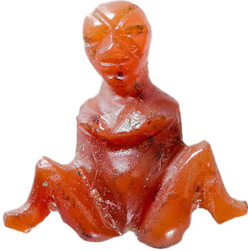
Figür 8: Karnelyan taşından Baubo-Omphale amulet, Geç Hellenistik-Erken Roma Dönemi, Metropolitan Müzesi (Nifosi 2019, 103 fig. 3.21b).

dolgun ve doğala yakın verilmesi, ikinci örneğin Augustus Dönemi'ne tarihlenmesi gerektiğini düşündürür. İlginç olan husus, Herakles'in arınma sürecinin bir parçası olan Lydia kraliçesinin toprak ana ile özdeşleşerek Herakles ile yaptığı "kutsal evlilik/ hieros gamos " ile bereket ve doğurganlık vasfı kazanması ve bu sayede de kadınlar tarafından amulet olarak tercih edilmesidir 59 . Özde Anadolu kültür tarihinde Prehistorik Dönem'den itibaren öne çıkan kadın ve bereket ilişkisi, Yunan mitolojisinde kahraman Herakles ile "Barbar" kraliçenin evliliğiyle Hellenistik Dönem görsel sanatlarında yer bulmuş ve önemini Roma Dönemi'ne kadar da korumuştur 60 .