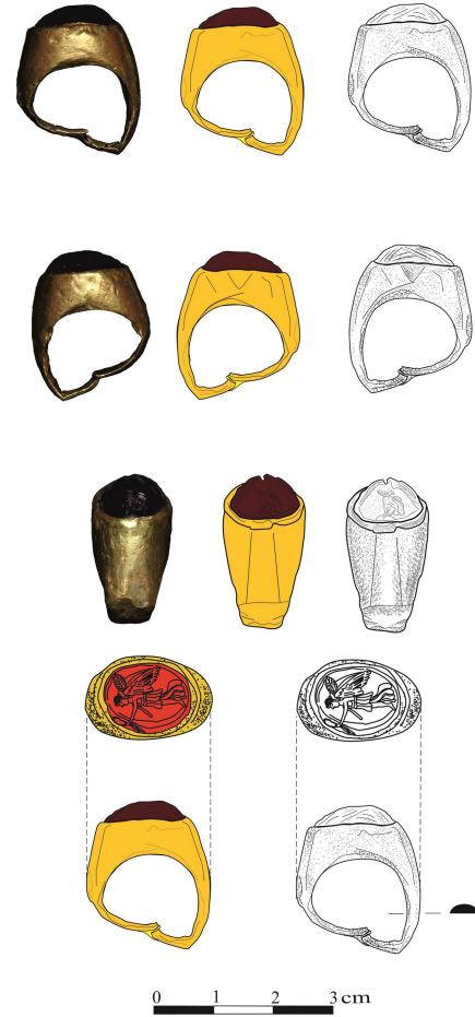
Figür 1: Burdur Müzesi'nde korunan yüzük (A. Soslu)