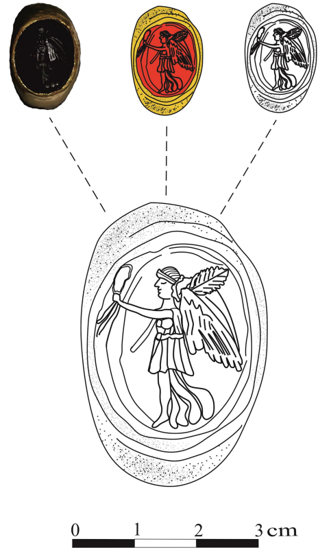
Figür 2: Yüzük taşının üzerinde yer alan Nike betimi (A. Soslu)

MS 1.-2. yüzyılda kalsedon, jasper, karnelyan ve akik gibi değerli taşlar üzerinde 74 Nike betimi oldukça yaygındır. Nike, yüzük taşının merkezine yerleştirilmiş tek figürlü sahnelerin yanı sıra tanrı ve tanrıçalar ile birlikte ikili kompozisyondan oluşan sahnelerde de görülmektedir. MS 1. yüzyıla ait iki yüzük taşında uçar pozisyonda Nike betimlenmiştir. Bunlardan biri Lahey Kraliyet Madeni Para Kabin'i'nde bulunan Değerli Taşlar