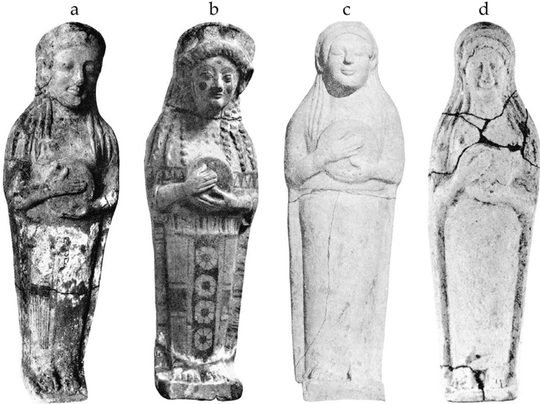
Figür 5a-d: Kartaca'da bulunan kadın plakaları (Ferron 1969, fig. 1-2)

Üçüncü örnek, Kıbrıs'ın davulcu figürlerinin en erken örneğidir 111 . Figür, sol göğsünün üzerinde büyük olasılıkla bir el davulu olan disk şeklindeki bir nesneyi tutan Geç Tunç Çağı'nın "kuş yüzü" kadını temsil etmektedir. Genellikle doğurganlık ve cinselliğe işaret eden bu tasvirlerde kadınlar ya bebekleri tutarken ya emzirirken ya da ellerini göğüslerinin üzerine koyarken betimlenmişlerdir. Çoğunlukla doğurganlık tanrıçası kültüyle ilişkilendirilen bu tipte davulun varlığı, enstrümanın kadın ve doğurganlıkla yakından ilişkili olduğunu düşündürmektedir 112 .