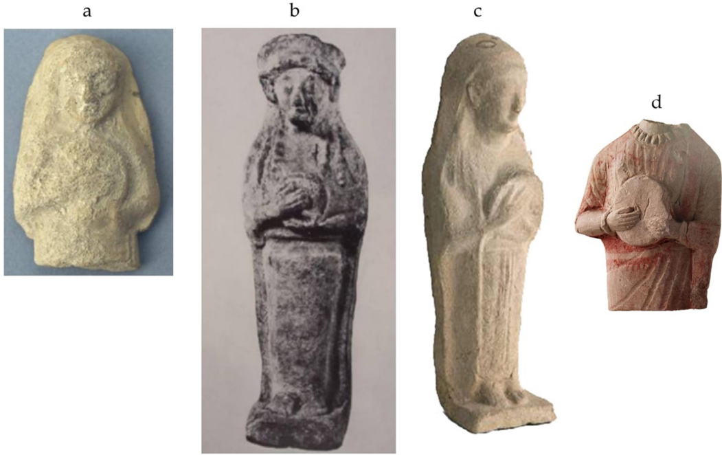
Figür 8a: Kilis/Oylum Höyük MÖ 600-330 (Topcu 2010, lev. 5, fig. 1); 8b: İtalya/Sardinya, MÖ 6. yüzyılın sonu-5. yüzyıl başı (Caporusso 1976, pl. XLI, fig. 62); 8c: İtalya/Sardinya, MÖ 6. yüzyıl (Pla Orquin 2017, 320, fig. 412); 8d: Kıbrıs/MÖ 4. yüzyılın ilk çeyreği (Çelik ve Kiraz 2007, 155).

Bir diğer irdelenmesi gereken konu ise müzik aleti ile belirli bir cinsiyet arasındaki bağlantıdır. İbiza'da bulunan müzikal performans sergileyen 18 figürün yalnızca ikisi erkektir ve bunlar da kaval çalan satyr tiplmesine aittir 149 ; el davulu çalanların tümü ise kadındır (fig. 6-7) ancak mevcut durum bu çalgının sadece kadınlar tarafından çalındığını göstermemektedir. Bir diğer olasılık ise vurmali çalgıların ağırlıklı olarak dans ile ilişkilendirilmesinden ve cenaze törenleri ya da yas ayinlerinde ağıt yakmanın yine kadınlarla ilişkili olmasından dolayı davulun doğurganlıkla ve doğurganlık ritüelleri olabilecek şeylerle bağlantılı bir müzik aleti olarak kadınlarla ilişkilendirilmesi gerektiği yönündedir 150 . P. Beck de Demir Çağı'na ait elinde davul tutan yaklaşık 30 figürü değerlendirdiği çalışmasında, bu figürlerin cinsiyetinin kadın olduğunu söylemektedir 151 . Nitekim bu tablo sadece İbiza figürleri için değil, Demir Çağı II İsrail figürleri için de geçerlidir 152 .