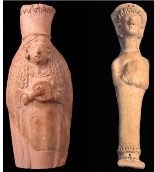
Figür 7: İbiza plakaları (Bertran et al. 2011, fig. 3)