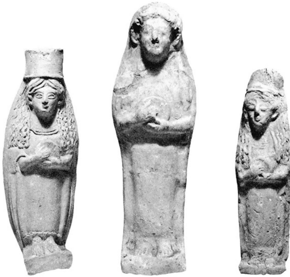
Figür 6: İbiza'da bulunan plakalar (Ferron 1969, fig. 7)