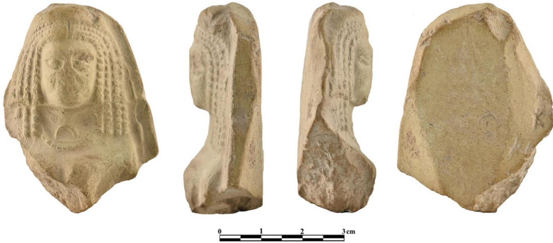
Figür 1: Muğla Müzesi'nde korunan Astarte plakası