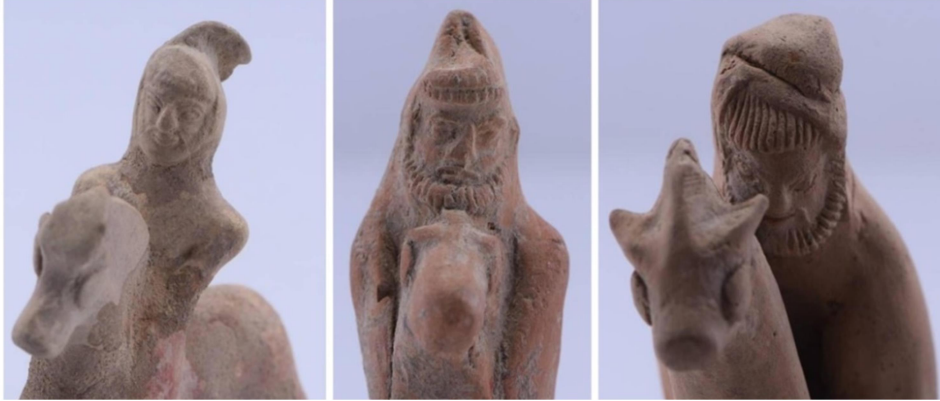
Figür 3: Diyarbakır Müzesi’ne satın alma yoluyla kazandırılan Persli süvari figürinleri (Yücel 2018, fig. 3B, 4B, 5B’den)

taşımaktadır 31 . Aynı alanlarda bulunan ve yayılım alanı açısından Astarte plakaları ile paralellik gösteren pişmiş toprak süvari figürinleri 32 (fig. 3), Erken Akhaimenid Dönem’den Akhaimenid sonrasına kadar bölgede hâkim olan Pers kültürünü simgeleyen en önemli buluntu grubunu oluşturmaktadır 33 . Demir Çağı tabakası içinde Saray-Tapınak kompleksinde ele geçen çivi yazılı tabletler ve damga bezemeli çanak çömlekler Astarte plakalarının geldiği yapının Pers/Akhaimenid Dönemi’nde, MÖ 6. yüzyıldan MÖ 4. yüzyıl sonuna kadar uzunca bir süre kullanılmış olduğunu göstermiştir 34 .