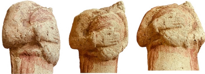
Figür 4c: Davul çalan kadın plakasından detaylar