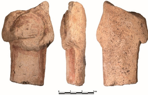
Figür 4a: Davul çalan giyimli kadın plaka parçası