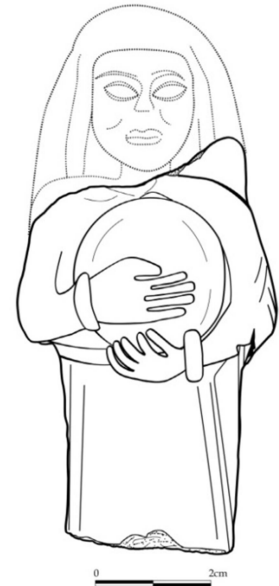
Figür 4b: Davul çalan giyimli kadın plaka parçasının tamamlama önerisi (N. Durnagölü)