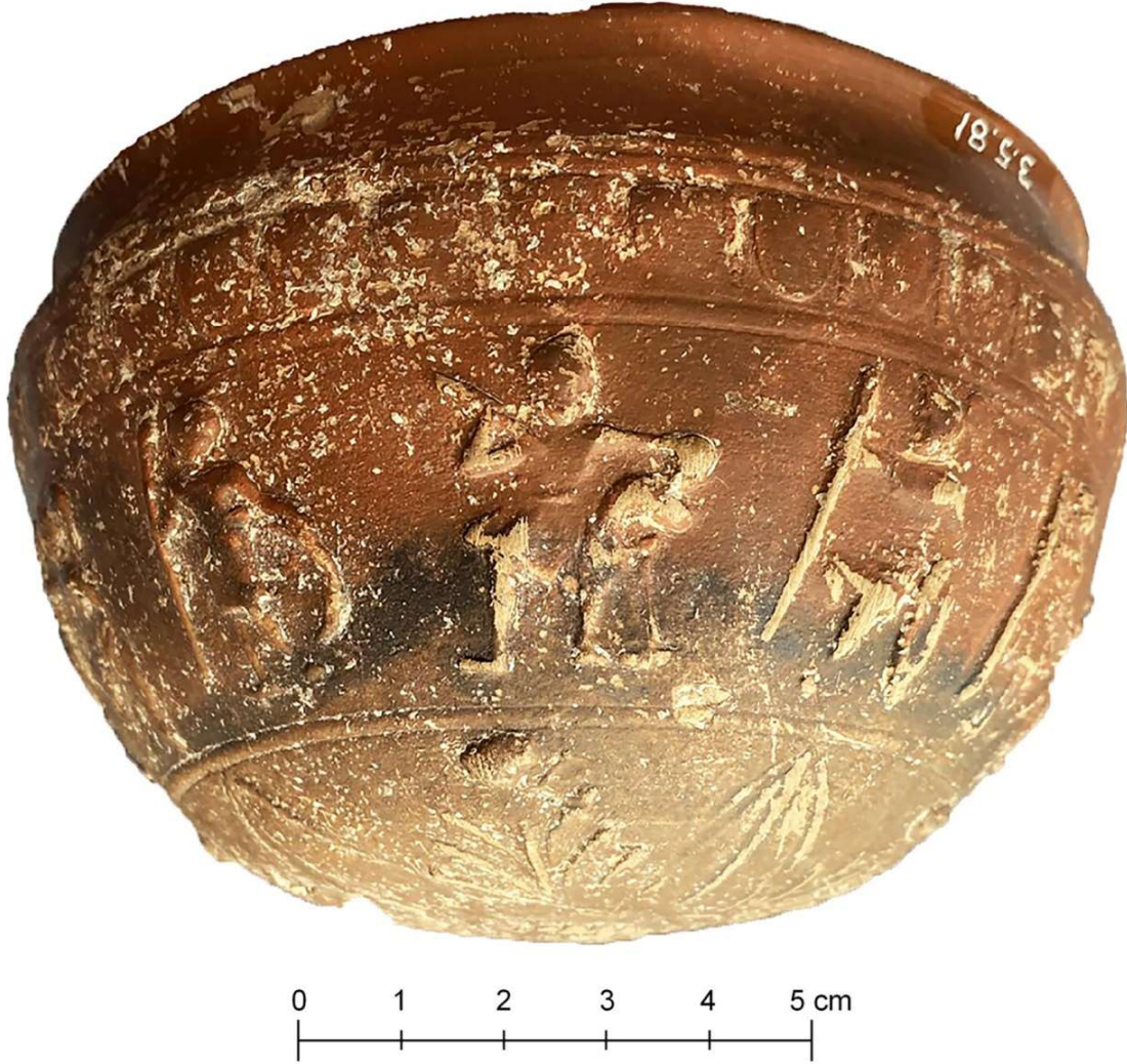
Figür 1: Kahramanmaraş Müzesi'nde korunan kabartmalı kâse

Ephesos'ta MÖ 2. yüzyıla 60 , Daskyleion'da Hellenistik Dönem'e 61 , Labraunda'da MÖ 3. yüzyılın ikinci yarısına 62 ve Boubon'da MÖ 2. yüzyılın ikinci yarısı ile biraz sonrasına 63 tarihlendirilmiştir. Boubon buluntularının kentte üretilmediği göz önünde bulundurularak, Ionia veya yakın çevresindeki üretim merkezlerine ait olabileceği belirtilmiştir 64 .