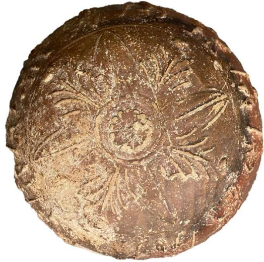
Figür 3: Kalyks kısmındaki bitkisel bezek