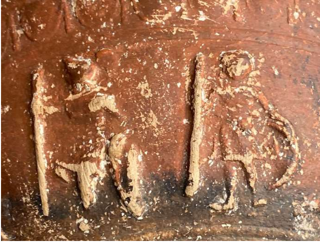
Figür 6: 4 ve 5 numaralı sahnede yer alan figürler

figüre doğru yönelmiştir. Giysisinin kumaş detayları göbek altında belirgin bir şekilde katlanarak iki bacak arasından aşağıya doğru kavisli kıvrımlar yaparak devam etmektedir. Figürün başında, sahnede ayakta tasvir edilen askerlerde olduğu gibi yüzü kapayan bir miğfer bulunmaktadır. Miğferin kenarlarındaki oval çıkıntılar ensenin sağ ve sol yanından seçilmektedir. Bu grupta yer alan ikinci figür ise mızraklı figürün sağında yer alan ayakta ve cepheden verilmiş diğer kadın figürüdür. İnce kumaşlı khiton üzerine kalın kumaşlı himation giymekte olan figürün giysi kumaşı, yanındaki figürle simetri oluşturacak şekilde sağdan sola doğru devam etmektedir. Yüz detayları belirgin değildir. Bu figürün sol kolu seçilemese de, sağ kolu dirsekten bükülerek solunda bulunan diğer figüre doğru yönelmiştir. Bu iki figürden birinin mızraklı diğerinin mızraksız betimlenmesi ve her birinin bir kolunun yöneliminin yanındakine doğru olmasından yola çıkılarak, bu iki figürün mızraklı olanının Athena, diğerinin ise Hera olduğu düşünülebilir. Benzer kompozisyon, Samos ve Atina kentlerinin anlaşma stelinde bulunan Hera ve Athena'nın dexiosis sahnesini çağrıştırmaktadır 91 . Ancak, sahnenin bu kısmındaki yoğun aşınmadan ve iki figürün birbiriyle temas ettiği ellerinin tam olarak seçilememesinden dolayı bunu kesin olarak söylemek mümkün değildir.