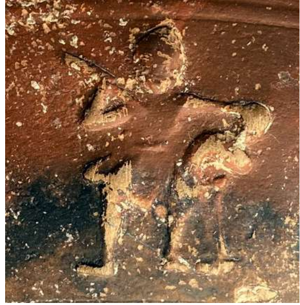
Figür 5: 3 numaralı sahnede yer alan betimler

No. 3, iki figürden oluşan bir gruptur (fig. 5). Sahnenin solunda, bacakları iki yana açık, hareket halinde, cepheden betimlenmiş bir erkek figürü vardır. Bu figür kısa kollu ve kısa etekli khiton giymektedir. Giysinin bel kısmında kumaş katı görünmekte, etek kısmında bacağın hareketine bağlı olarak kumaş dalgalanarak diz üzerinde belirginleşmektedir. Figür sağ kolunu dirsekten bükerek havaya kaldırmış, omzunun üzerinden soluna doğru mızrağını saldırı pozisyonunda tutmaktadır. Başında tepe kısmı oval biten bir miğfer bulunmaktadır. Yüz detayları seçilememektedir. Sol kolu ile yanında duran figürün başını kavramıştır. Yanındaki figür aşınmadan dolayı tam olarak seçilemese de, göğüs kısmı vücuduna göre oldukça dışarıda verilmiş, kıvrımları dalgalanarak yere kadar inen kısa bir elbise giymiştir. Göğüs kısmının belirgin oluşu sebebi ile söz konusu betimin bir kadın olduğu düşünülmektedir. Eğer öyleyse, sahnede amazonomakhia konusu betimlenmiş olmalıdır. Mitolojide kadın savaşçılar olarak anılan amazonlar, Hellenistik Dönem'de oldukça sevilen bir konudur. Erkek figürünün pozisyonu, Ressam Eksekias'ın bir amphorasında resmettiği 90 , Akhilleus'un amazon kraliçesi Penthesilea'yı öldürme anında görülen sağ elindeki mızrağı havaya kaldırma anıyla benzerlik göstermektedir. No 3'teki saldırılan figürün tam olarak seçilememesi, pozisyonu ve kimliği hakkında yorum yapmayı güçleştirmektedir.