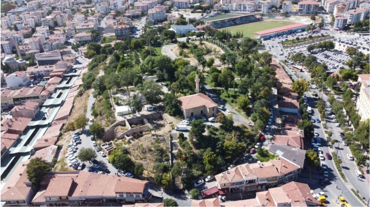
Figür 1: Kırşehir Kale Höyük doğu tarafından hava fotoğrafı ve güney bölümdeki açmalar

Yukarıda verilen bilgilerden sonra mühürlü kulpların değerlendirilmesi ve yorumlanabilmesi için üretim merkezlerine göre sınıflandırılan her bir parça tek tek ele alınarak tanıtılmıştır. Bu makalede, Kale Höyük'te bulunan amphora mühürlerini tarihlemek ve üretim merkezlerine göre sınıflandırmak amaçlanmıştır.