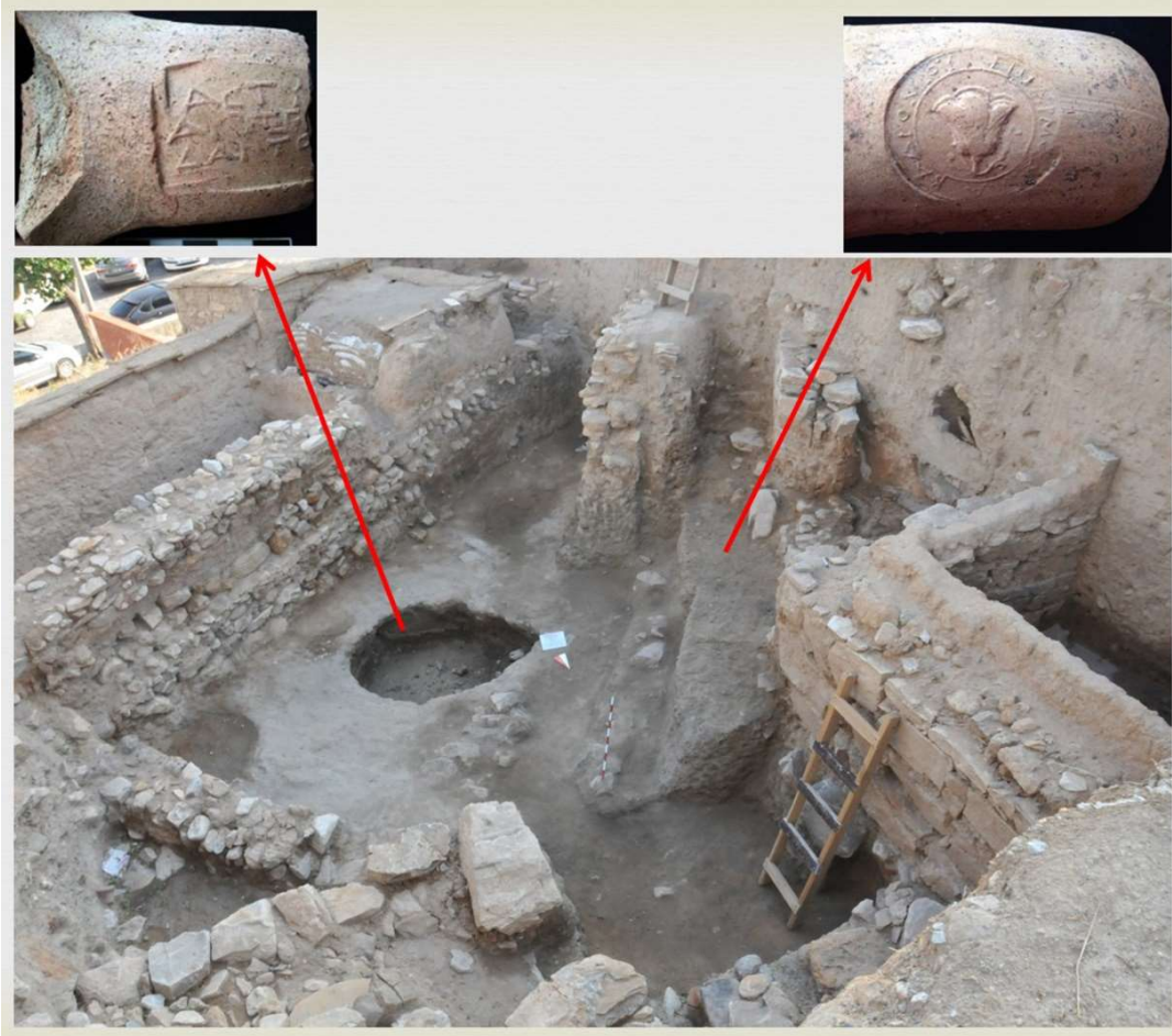
Figür 3: H4 plankaresinde mühürlü kulpların çıktığı üniteler