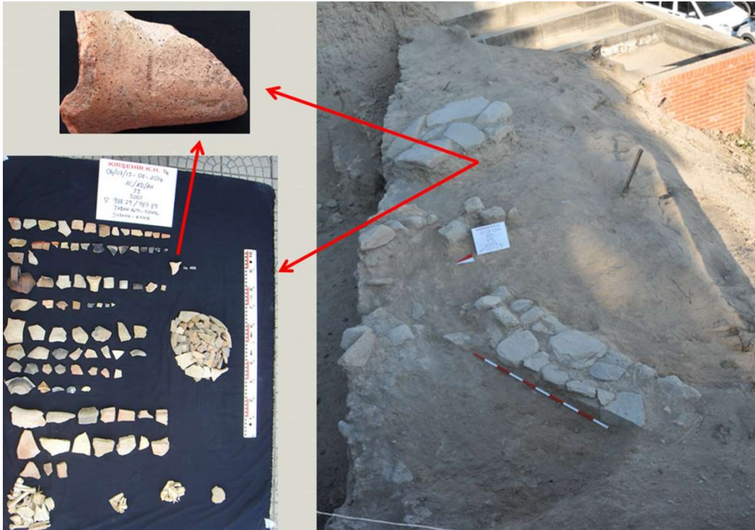
Figür 4: J3 plankaresinde mühürlü kulpun çıktığı ünite ve konteksti