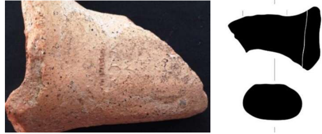
Figür 7: Kalehöyük'te bulunan Sinope amphora mührü

Diğer Sinope mührünün üst bölümünün bir kısmı ve sağ tarafı kırıktır (kat. no. 3; fig. 7). Mührdeki yazıt, benzer örneklerden hareketle tamamlanabilmiştir. Mührün birinci satırında üretici \text{Κτήσων II} 'nin ismi bulunmaktadır. İkinci satırda yönetici isminin unvanı olan \acute{\alpha}\sigma\tau\upsilon\nu\acute{\omicron}\mu\omicron\varsigma kullanılmıştır. Baskının üçüncü ve