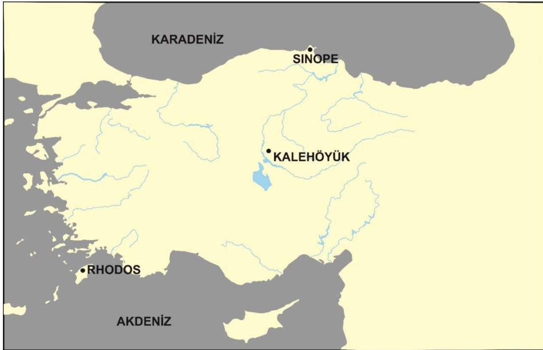
Figür 8: Kırşehir Kale Höyük ve burada ele geçen ithal amphoralara ait mühürlerin üretim merkezleri