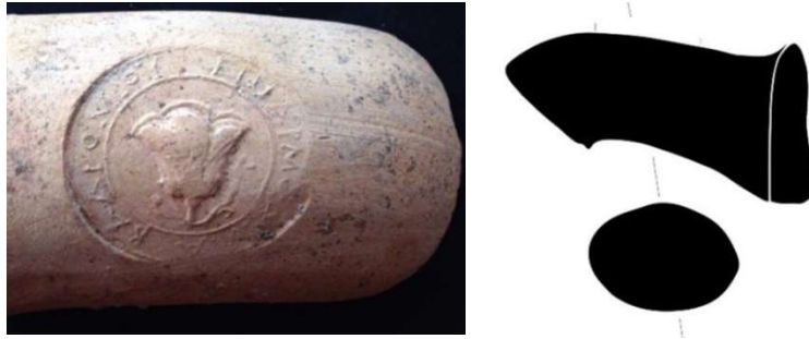
Figür 5: Kalehöyük'te bulunan Rhodos Amphora Mührü