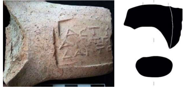
Figür 6: Kalehöyük'te bulunan Sinope amphora mührü

Mührün birinci satırında \acute{\alpha}\sigma\tau\upsilon\nu\acute{\omicron}\mu\omicron\varsigma unvanı ile ikinci satırında yönetici \text{Ἀρτεμιδώρος II} ve üçüncü satırında üretici \text{Δᾶς II} 'nin isimleri bulunmaktadır (kat. no. 2; fig. 6). Kale Höyük buluntusu bu mührün sağ bölümü kırık olmasına rağmen, yazıt benzer örneklerden hareketle tamamlanabilmiştir. Bu yöneticinin Sinope amphora mühür kronolojisinde görev yaptığı yıl, Grup V (MÖ c. 257 – c. 190) olarak belirlenmiştir 29 . Yönetici ile ilişkili mühürlerin sağ tarafında sembol olarak kantharos veya krater gibi kap formları kullanılmıştır 30 . \text{Ἀρτεμιδώρος II} 'nin üreticilerden \text{Πρῶτος} 31 , \text{Ἀγάθων} , \text{Θυαίας} , \text{Μιθριδάτης} , \text{Φιλοκράτης} 32 , \text{Καλλιθένης} 33 ve \text{Κλέων} 34 ile bağlantıları belirlenmiştir. Bu yöneticiyle ilişkili mühürler Dobrogei 35 ve Kallatis'te 36 ele geçmiştir. Üretici \text{Δᾶς II} 'nin birçok yönetici ile bağlantılı olduğu anlaşılmıştır 37 .