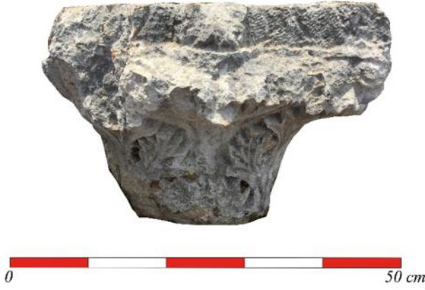
Figür 7: Kat. no. 7

ince uçlu yan yapraklar ve akanthus yaprakları ile kaplanması ve matkap işçiliği ilk iki gruptan ayrılmasına neden olmaktadır. Ancak tarihlendirme konusunda ilk iki tiplerle yakın tarihlerdir ve bu tipin kireç taşından yapılanlarının Likya, Kilikya ve Isauria'da yaygın bir özellik olarak görüldüğü bilinmektedir 13 . Bu tür başlıklar "Theodosian tipi başlıklar" olarak adlandırılmakta ve MS 5. yy'ın ikinci yarısına tarihlendirilmektedirler 14 .