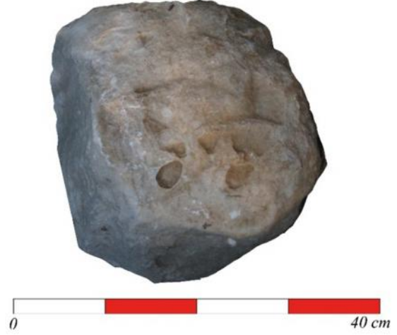
Figür 4: Kat. no. 4