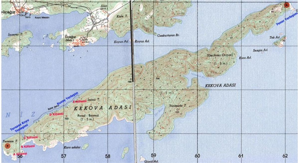
Harita 1: Kekova Adası yerleşim haritası

araştırmalarında 2 tespit edilen korinth başlıklarının tamamı ada üzerindeki bu kiliselerden iki tanesinde bulunmuştur. Ada üzerindeki Erken Bizans Dönemi'ne ait dinsel yapıların yoğunluğu ada halkına hizmet vermenin yanında, Andriake kiliselerinde olduğu gibi 3 buraya deniz yoluyla beş kilometre mesafede bulunan Myra'daki Aziz Nikolaos Kilisesi'ne deniz yoluyla gelen hacılara da hizmet veriyor olmalıdır. Nitekim ada kıyılarında yapılan sualtı araştırmalarında da yakın döneme (MS 5.-7. yy) tarihlendirilen çok sayıda ticari amphora 4 , bölgenin yoğun ticari trafiğinin bu haç ziyaretlerindeki tüketim ihtiyacını gidermeye yönelik olduğunu düşündürmektedir.