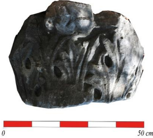
Figür 3: Kat. no. 3

Üçüncü tip olarak ayırdığımız başlık kireç taşından yapılmıştır. Başlığa ait sadece iki parça bulunabilmektedir (fig. 6 – kat. no. 6). Bu parçalardan ilki 0,15 x 0,16 m ölçülerindedir ve başlığın abakus , kalathos dudağı, volüt ve üst yaprak çelengi bölümünün kısmen görülebildiği küçük bir parçasıdır. İkinci parça ise 0,20 x 0,20 m ölçülerinde, başlığın alt bölümüne ait bir parçadır. Üzerinde kalathos taban bileziği ve alt yaprak çelengi ile çelenk yaprakları arasındaki daha küçük ince uçlu yan yapraklar kalathos un tüm yüzeyini kaplamıştır. Abakus ve kalathos taban bileziği üzerinde iki sıra halinde matkapla açılmış delikli bir bordür bulunmaktadır. Bu başlık hem volütlü oluşu hem de işçiliği ve yaprak sitili ile diğer gruplardan ayrılmaktadır.