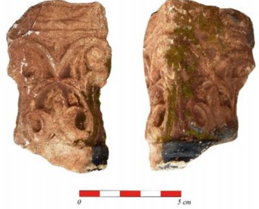
Figür 8: Kat. no. 8

Kuzey Yerleşim E Kilisesi korinth başlıkları ise stilistik açıdan yukarıda tanımlanan başlıklardan ayrılmakta ancak kendi içinde bir bütünlük göstermektedir. Öyle ki her ne kadar boyut ve kompozisyon bakımından farklı görünseler de başlık tabanından başlayıp volüte kadar uzanan ve volütü de taşır biçimde verilen köşe akanthus ları, yaprakların verilmiş biçimi ile benzerlik taşımaktadırlar (fig. 8). Kuzey Yerleşim E Kilisesi başlıkları stilistik açıdan benzerleri Ayasuluk Tepesi'nde, Beyşehir Yunuslar Köyü'nde ve Bergama'da MS 5-6. yy'lar arasında tarihlendirilmektedir 15 .