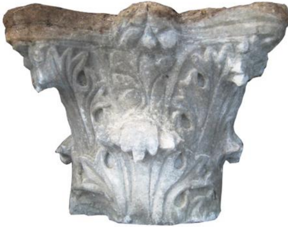
Figür 1: Kat. no. 1