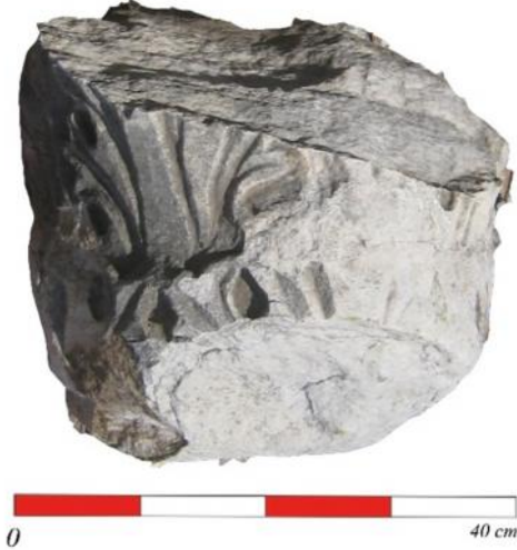
Figür 5: Kat. no. 5

başlık tabanından başlayıp volüte kadar uzanmakta ve volütü de taşır biçimde verilmiştir. Başlıkta, iki kademeli abakus , kalathos dudağı ve yaprak çelengini çevreleyen stilize heliksler ve volütler görülmektedir. Kalathos taban bileziği bulunan başlıkta, kaulis , kaulis başlığı ve abakus çiçeği yoktur 7 . Çalışmamızda yer alan diğer başlıklar boyutları itibariyle ya kilise neflerini ayırmada kullanılan sütunların üzerinde ya da orta nef ile bemayı ayıran templon bölümünde kullanılmış olmalıdırlar. Ancak küçük boyutlu olan başlık ya altar masasında ya da kiborionda kullanılmış olabilir.