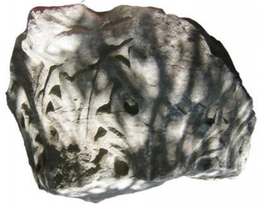
Figür 2: Kat. no. 2

İkinci tip korinth başlığı ise 0,26 x 0,37 m ölçülerinde ve kırılmış durumdadır (fig. 5 - kat. no 5). Başlığın sadece bir yüzünde yine kırılmış durumda yarım bir akanthus yaprağı ve altında damla biçimli yaprakçık gözleri görülebilmektedir. İlk gruptaki başlığın akanthus yaprağı düzenlemesine benzer biçimde işçilik gösteren başlıkta bezemeler daha yüzeysel verilmiş, yaprak arasındaki damarlar ve gözler ilk gruba göre daha az derinlikte nispeten çizgiseldir. Başlığın alt bölümü ve üst bölümü günümüze ulaşmadığı için kalathos yüzeylerinin biçimi görülememektedir.